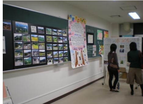
↓ボランち。活動報告