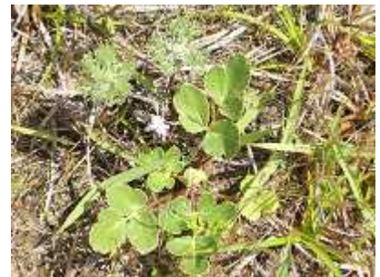
まちおこして復活させる浜防風