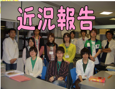
スタッフ集合写真

5月22日に教育人間科学部棟周辺、5月30日に理学部棟周辺、6月5日に総合教育研究棟周辺にて学内ゴミ拾い散歩を行いました。普段は何となく綺麗に見えるキャンパス内ですが、実際にゴミ拾いをしてみると、結構汚れているという印象を受けました。やっぱりゴミは定期的に拾っていかないと、キャンパスはなかなか綺麗にはならないと実感しました。